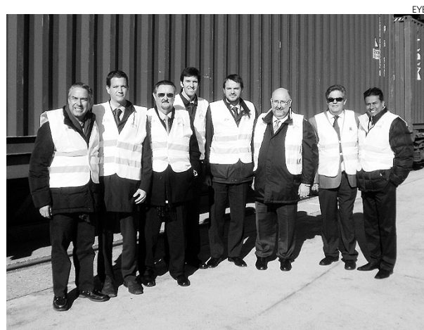
Visita al Puerto Seco de Azuqueca, en Guadalajara.

ción societaria pública y privada, Puerto de Barcelona, Puerto de Bilbao, Puerto de Santander y Gran Europa. El Puerto de Veracruz, ubicado privilegiadamente en el Golfo de Méjico, es el primer puerto de contenedores del Golfo y primero en Méjico en número de vehículos y en toneladas de mercancía