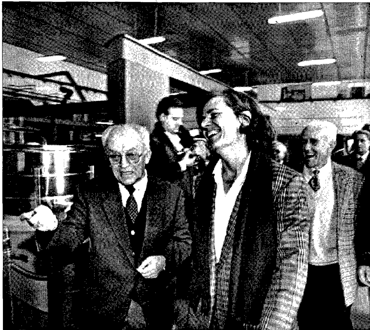
DE VISITA La ministra Loyola de Palacio enseña a los embajadores de Holanda y Austria el proceso de extracción del aceite en una cooperativa de Martos.

Walter Tausch, por su parte, destacó que no apoyarán ninguna reforma contra los intereses fundamentales de los países productores de aceite de oliva y que el Gobierno austriaco dará a este asunto "un tratamiento lo más adecuado posible desde el punto de vista de la solidaridad territorial", aunque lamentó la escasa penetración de este producto español en su país.