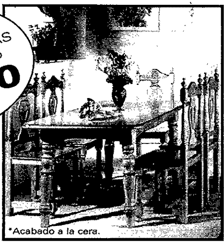
*Acabado a la cera.

CONJUNTO MESA y 6 SILLAS en pino macizo 89.400 Ptas.