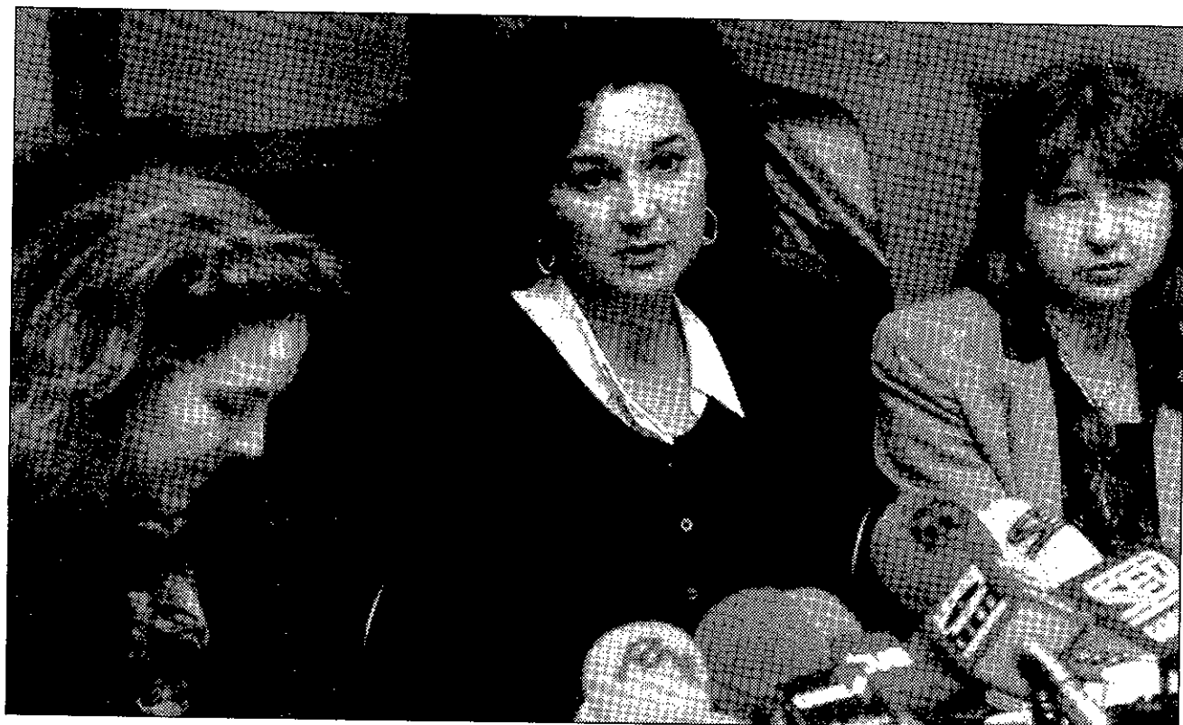
La consejera de Sanidad se refirió a la necesidad de reivindicar el asociacionismo femenino para hacer posible el principio de igualdad.

La Asociación de Mujeres Progresistas de Guadalajara está formada por un grupo de mujeres heterogéneo: mujeres jóvenes, mayores, con distinta formación, trabajadoras en el hogar y fuera de casa, y de diferente ideología. «Somos una organización social no gubernamental que espera que aquellas mujeres con inquietudes, desde posicionamientos de progreso social se sientan refle-