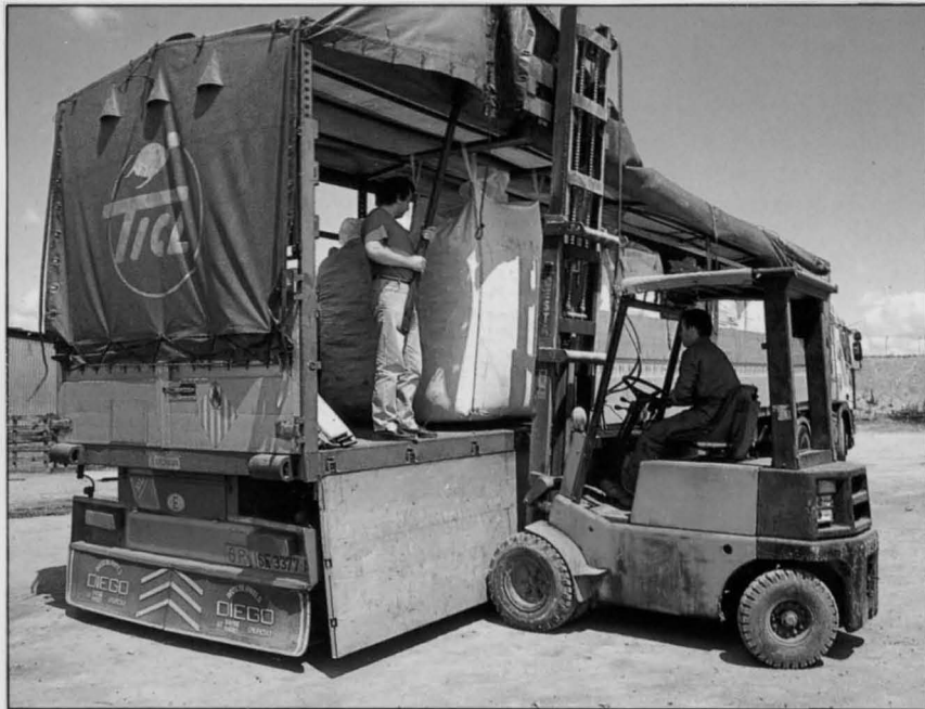
Operación de carga de los últimos sacos.

La Junta de Castilla-La Mancha sancionó además a las tres empresas responsables a pagar cuantiosas multas. La empresa MPRISA fue sancionada con 30 millones de pesetas, en tanto que CEPESA Y Rhone Poulenc Fibras, S.A. tuvieron que pagar 15 millones de pesetas cada una. Estas son las sanciones de mayor cuantía impuestas