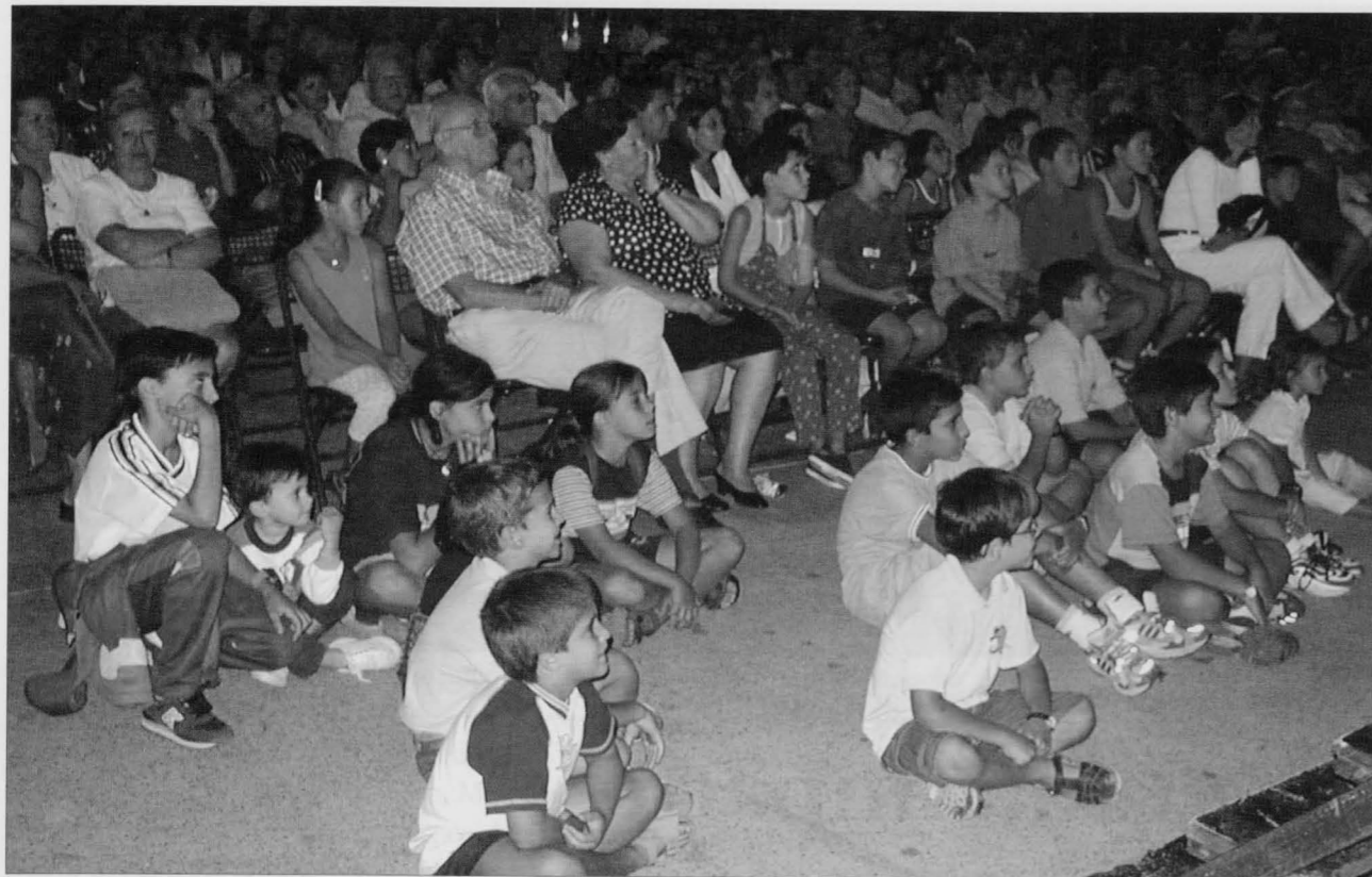
Esta quinta edición se desarrolla del 6 al 10 de noviembre