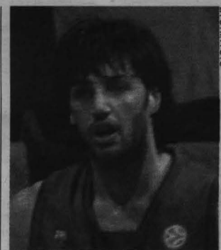
Basile regresa a su país para enfrentarse al Lottomatica.