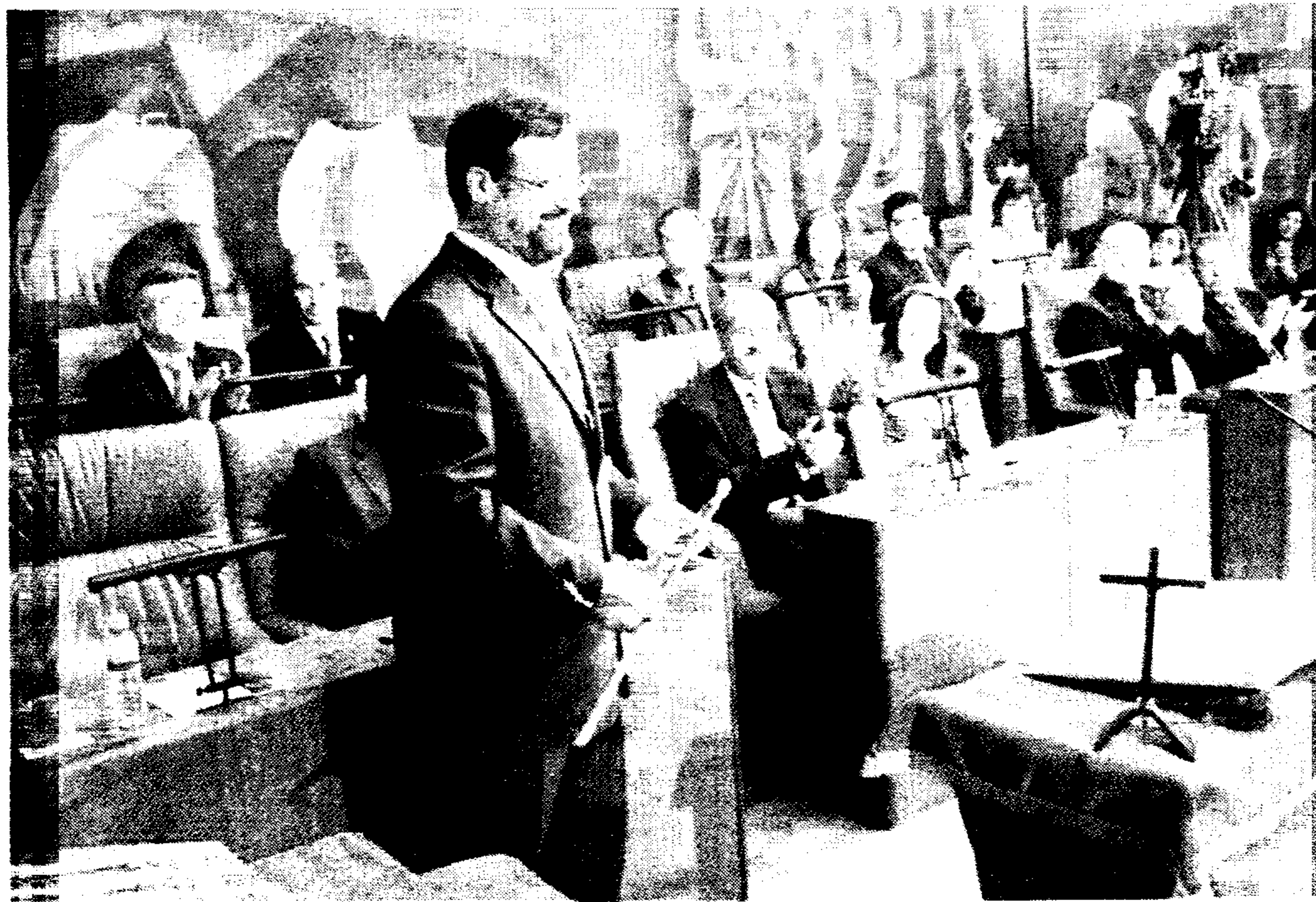
Nemesio de Lara durante el acto de investidura como presidente de la Diputación ciudadrealeña