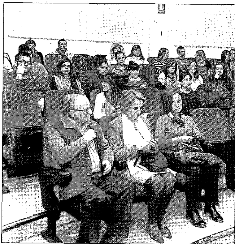
Al acto acudió un público variopinto, no sólo de universitarios.