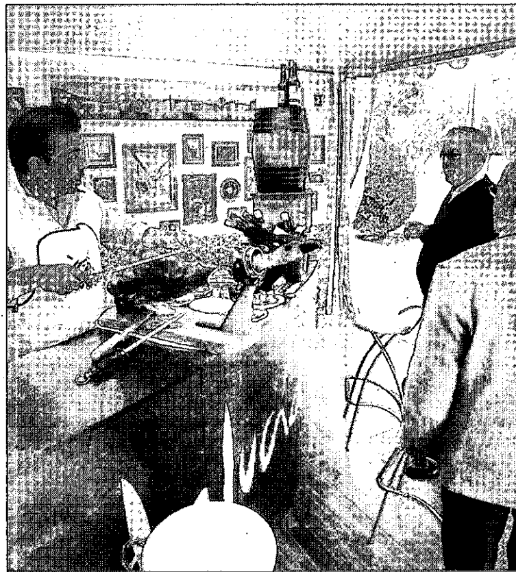
En la carpa se puede degustar jamón de la tierra y manzanilla.