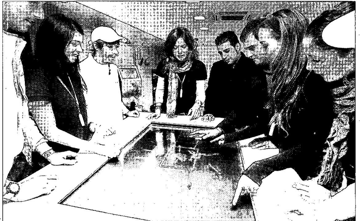
La gran 'plasma-wall' permite a los visitantes recorrer conjuntamente diversos lugares de Andalucía.