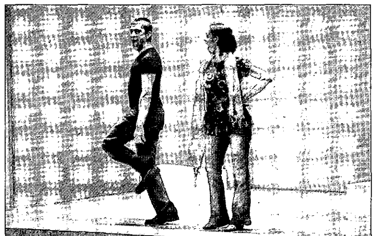
Un momento de la representación del grupo Casa de pájaros.

Es un planteamiento que genera situaciones divertidas y atractivas para el público, entre la nostalgia, la ironía y un tanto de reflexión.