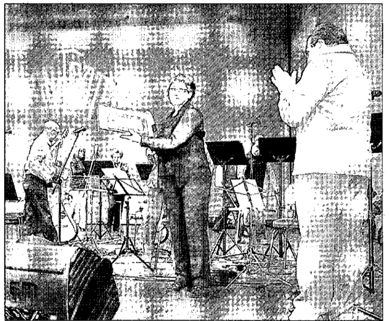
Entrega del premio a la agrupación toledana de Jaraíz.

Además, Jaraíz cuenta con un extenso currículum de participación en concursos y certámenes, actuaciones en programas de radio y televisión, y numerosas colaboraciones en eventos relacionados con la música tradicional.