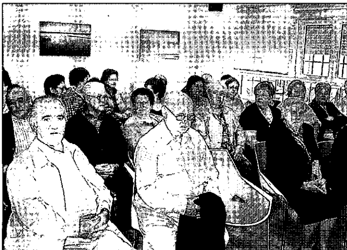
Asistentes a la charla sobre los genéricos en Manzanares.