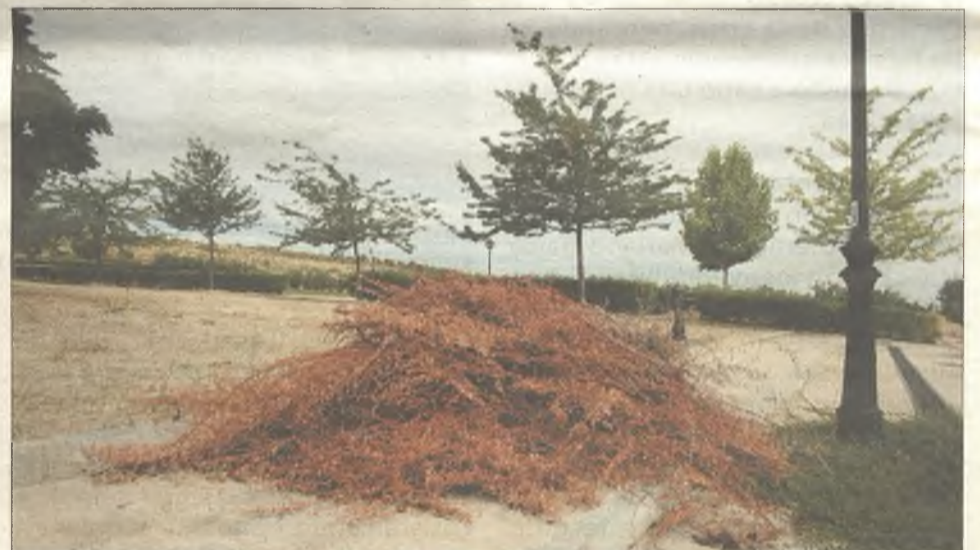
Un ejemplo de limpieza deficiente en Cabanillas del Campo.