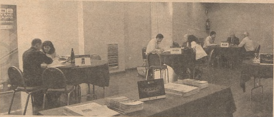
Durante toda la jornada se desarrollaron más de 400 contactos comerciales entre las diferentes empresas participantes.