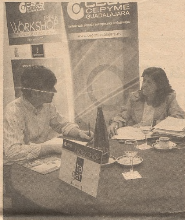
Tanto empresarios demandantes, como aquellos que actuaron como proveedores, se mostraron muy satisfechos con el evento.