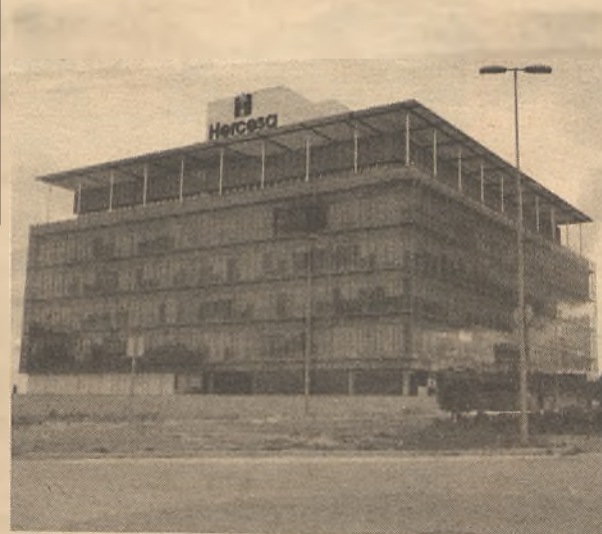
Imagen del edificio Europa, sede de Hercesa en la capital alcarreña

Hercesa se define por una gestión profesional innovadora, que está totalmente orientada hacia el cliente y la calidad. Es la primera empresa inmobiliaria española que obtuvo la doble certificación del Bureau Veritas y AENOR, que acredita que el sistema de garantía de la calidad adoptado por Hercesa supera las exigencias de la norma ISO 9001:2008.