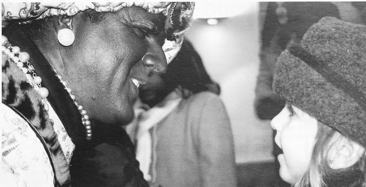
El rey Baltasar atiende a una emocionada niña.