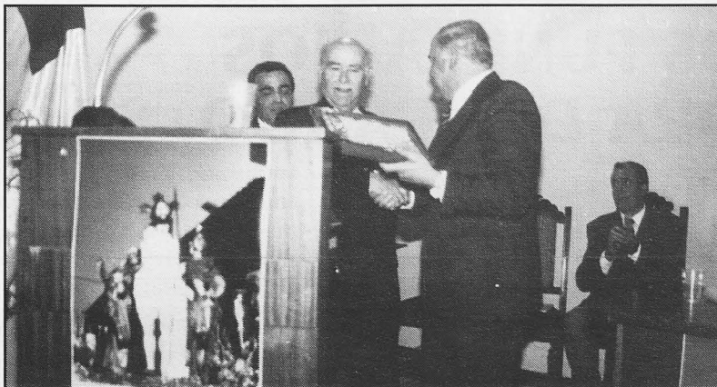
El Pregonero recibe una placa del Presidente de la Asociación de Cofradías.