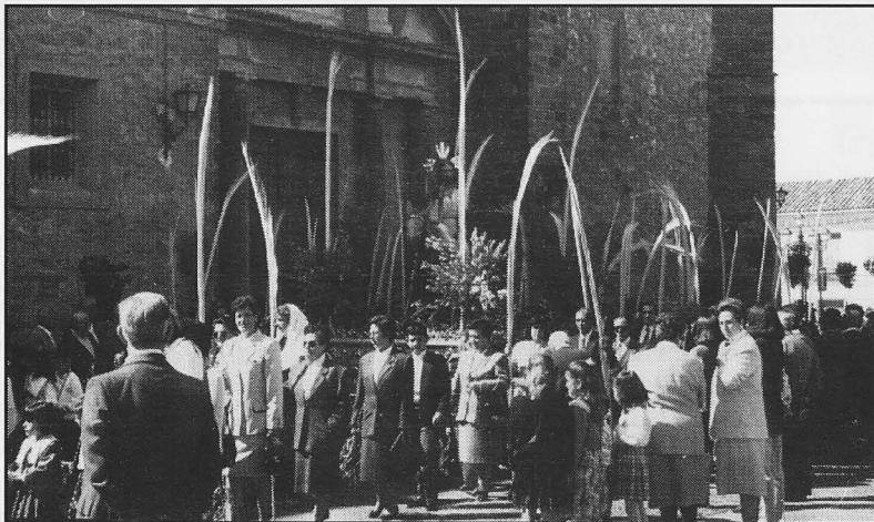
La borriquilla a su paso por la Plaza Mayor