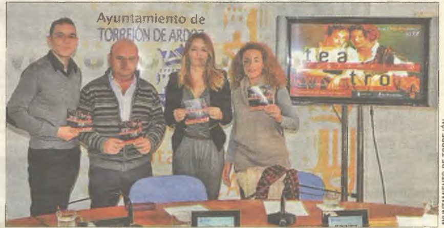
La programación trimestral del teatro municipal convoca a la élite artística

En estos primeros meses del año tendrán lugar tres estrenos nacionales, como La diosa impura , Bodas de sangre y Agosto . Además, se representarán