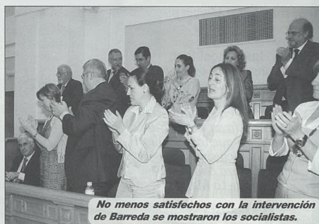
No menos satisfechos con la intervención de Barreda se mostraron los socialistas.

Se acabó la aventura de la reforma del Estatuto de Castilla-La Mancha. El pleno extraordinario del Parlamento regional aprobó, con los votos a favor de los socialistas y en contra del PP, la retirada del texto de las Cortes Generales. El debate discursivo en medio de una gran tensión y de acusaciones mutuas de fracaso.