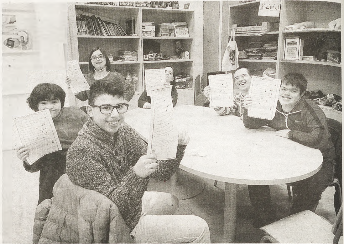
Grupo de participantes en la experiencia prelaboral

ción de «mini trabajos» en los que se les han ido encargando tareas que tenían que realizar de una manera correcta y en el plazo programado donde ponían en práctica aspectos como habilidades sociales, trabajo en equipo, seguimiento de instrucciones, pedir ayuda y responsabilidad, entre otros. Con este método también han aprendido a receptionar los pedidos, hacer inventario de los materiales que han ido necesitando, comprar los materiales necesarios y administrar el dinero o tratar con el cliente. Con esta actividad se ha llevado a cabo la «venta» de los encargos que han ido recibiendo por un módico precio, que se ha destinado a las actividades que ellos han elegido realizar por con-