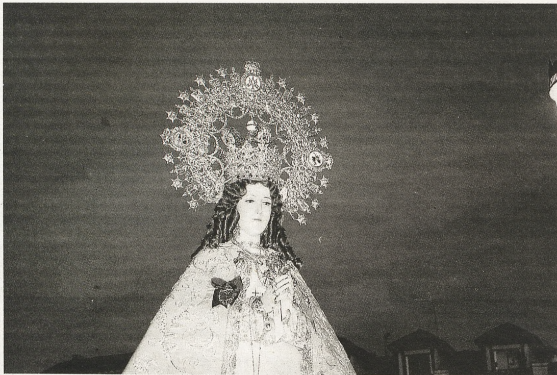
La Virgen de Consolación peregrina a las tres parroquias que conmemoran el cincuentenario