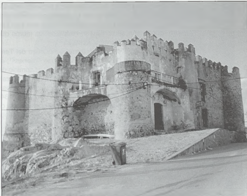
Valencia del Ventoso