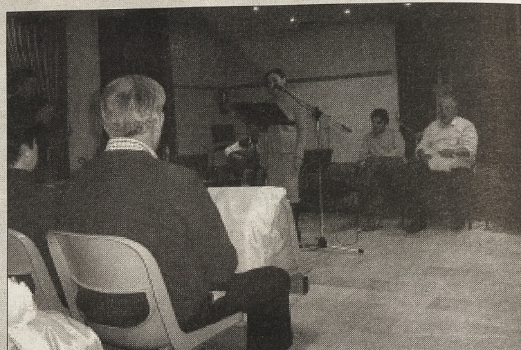
El público disfrutó del recital Domingo Carneros y Alfonso Arévalo