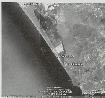
Situación de las baterías Cabo de Gata en el extremo Este de la Bahía de Almería

La batería de Cabo de Gata se compone de un conjunto de elementos militares dispuestos en un área reducida pero con importantes desniveles por el cerro donde