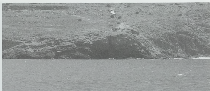
Búnker de Cabo Gata visto desde el mar

Consta de una plazoleta-balconada semicircular de unos 30 m 2 , con una habitación cubierta anexa a