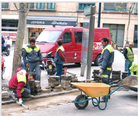
Obras del Plan de Barrios.

➤ Inversión de 30 millones de euros al Plan de Barrios y Pedanías.