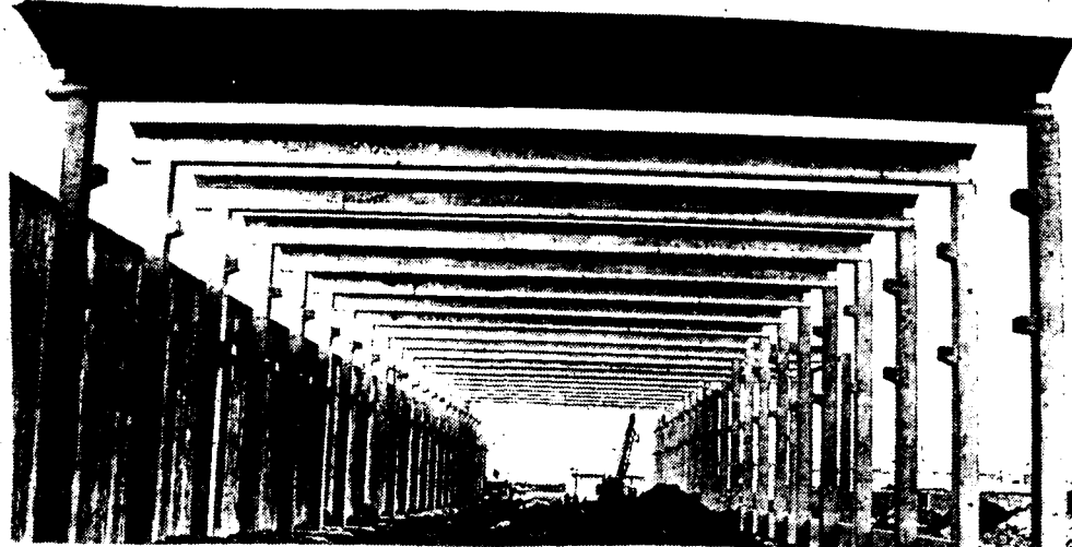
(Fábricas: C.Real, Toledo, Albacete, Cuenca)

GRANDES NAVES CUBIERTA PLANA PARA LUCES DE HASTA 40 M.