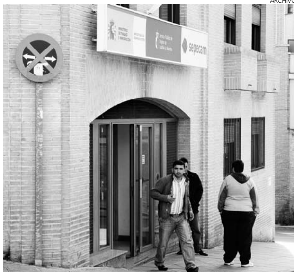
Los despidos improcedentes, a cargo del empresario.