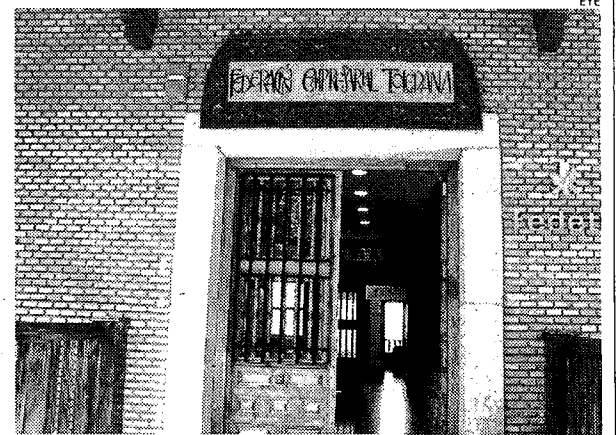
La Federación Empresarial Toledana, preocupada.