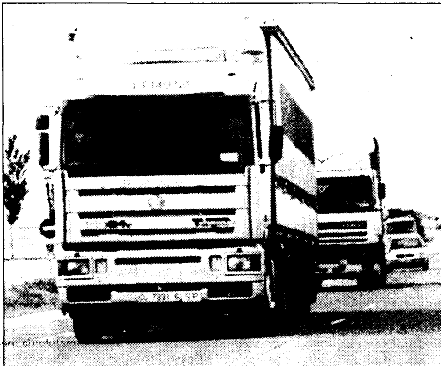
La empresa cuenta con 117 camiones distribuidos por toda Europa.

como una aventura arriesgada, cuando hace 35 años cuatro conductores decidieron dar el salto y crear una empresa en su pueblo. De la mano de otros transportistas, que trabajaban en régimen de autónomo en diferentes compañías, se unieron y empezaron con el tráfico de mercancías.