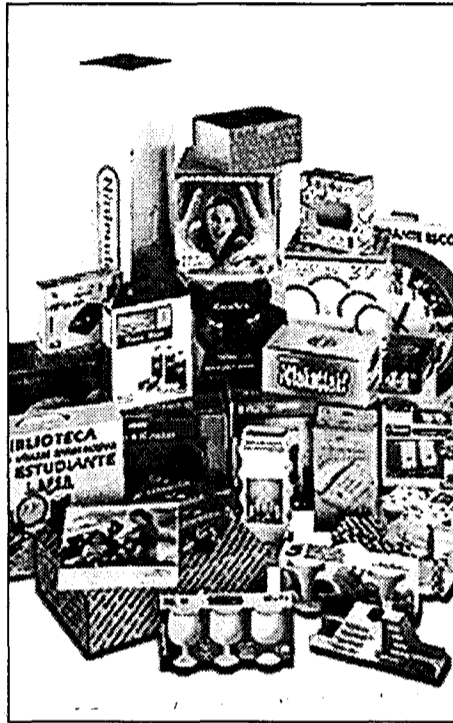
En la imagen parte de las instalaciones y productos de la firma.

Una de las últimas inversiones se han materializado en la ampliación de la nave y los terrenos que tiene en Villanueva de la Torre (Guadalajara), donde se han construido 1.250 metros cuadrados más que se han unido a los 1.250 que ya tenía edificados. Villanueva de la Torre está situada a tan sólo tres kilómetros de Azuqueca de Henares, núcleo urbano que está conociendo una gran expansión industrial dentro del denominado Corredor del Henares, y cuyos crecimientos