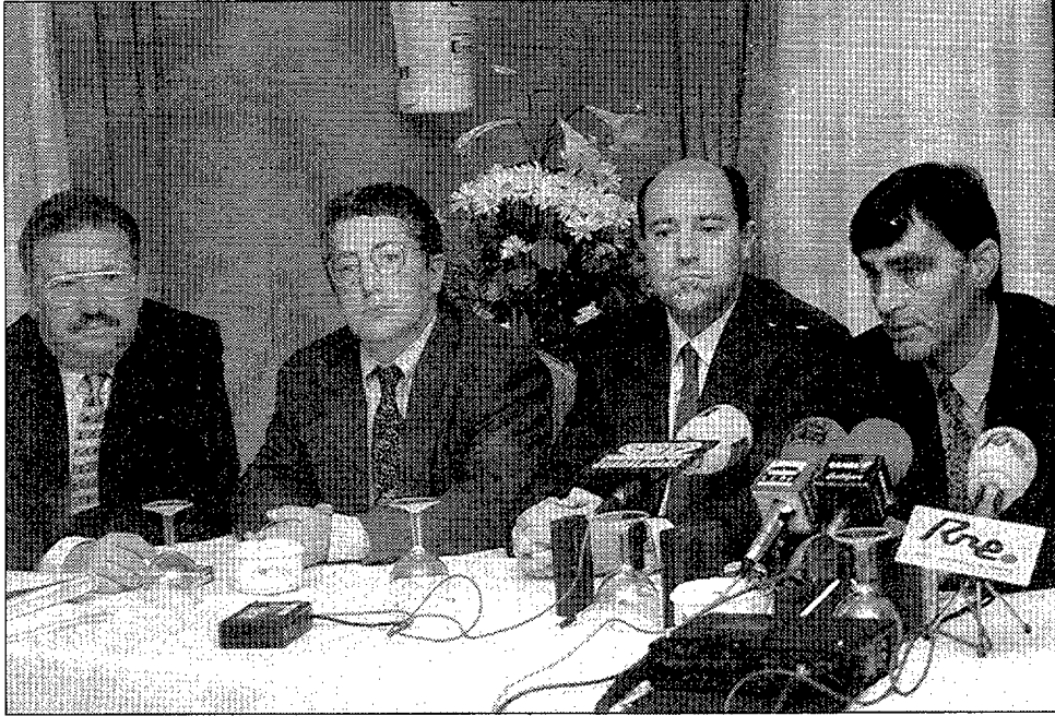
Parte de la directiva que gestiona el “Leader II” desde “ADEL Sierra Norte”.

Con los expedientes aprobados se materializará la construcción de un hotel, la modernización de una empresa de maderas y parquet y la adquisición de maquinaria para una empresa de artesanía en Sigüenza, la reforma y modernización de un hostel en Cogolludo, una casa rural en Campillejo, un albergue rural en Arbacón, otra casa rural y la instalación de una depuradora biológica en Tamajón, un restaurante en Campillo de Ranas, una casa rural y un centro de actividades de ocio en Monasterio, una empresa de actividades al aire libre en la sierra del Ocejón, una plantación de trufas en Barbatona, la sustitución de la línea de envasado de agua mineral en PVC por PET en Moratilla de Henares, la modernización de una empresa de extracción de áridos en Cubillas, un estudio de diseño en Ures y una sub-