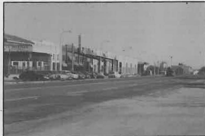
El municipio se ha dotado de polígonos residenciales, industriales y dotacionales. El polígono de la Estrella está permitiendo el asentamiento y desarrollo de diversas empresas.