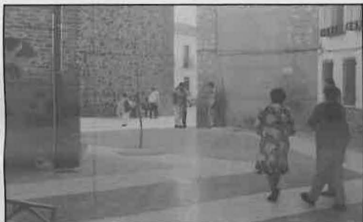
Las zonas peatonales van tomando poco a poco mayor protagonismo y cambiando el perfil de la localidad. La Plaza de la Virgen también dispone de su zona peatonal.

- Zonas peatonales 1995: Adán Nieto, Ave M a , Doctor Fleming-parque, Plaza Constitución y de España y Plaza de la Virgen.