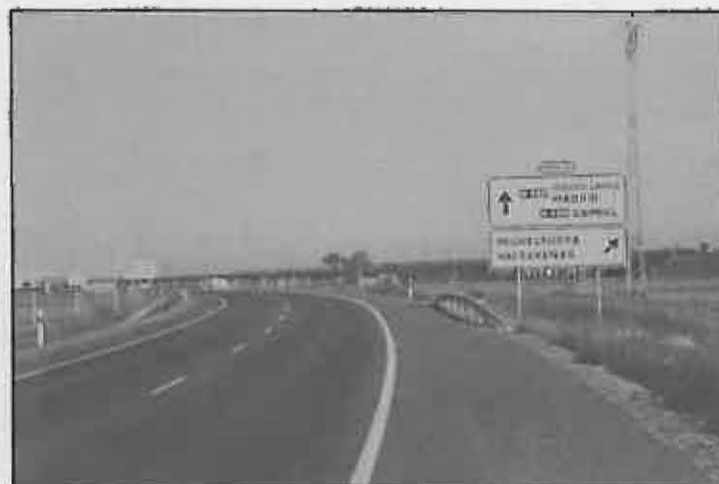
La mejora de las comunicaciones ha sido extraordinaria: la variante de Puertollano permite acceder a Miguelterra sin necesidad de entrar en Ciudad Real.

tondas en la carretera, a su paso por la localidad, para facilitar la entrada y salida de vehículos.