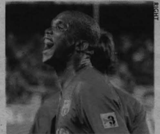
Con sus dos goles ayer, Eto'o llegó a los 100 con el Barça.