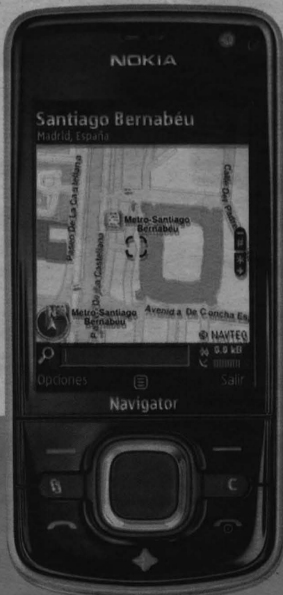
Nokia 6210 Navigator