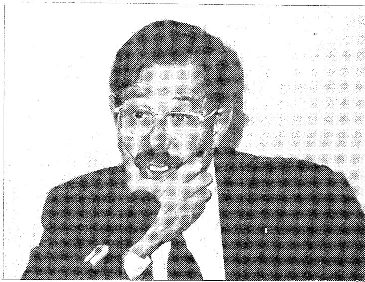
Javier Solana, en la habitual rueda de prensa tras el Consejo de Ministros.

Javier Solana dijo también que «España ha perseguido a aquellas personas que se ha supuesto que tenían alguna relación con el