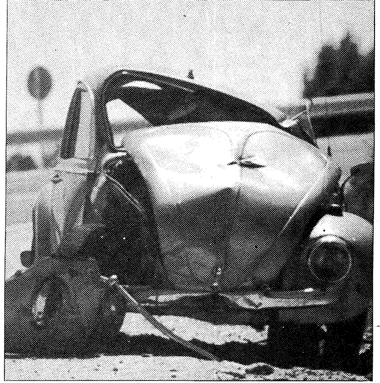
Cada vez se producen más accidentes en Castilla-La Mancha