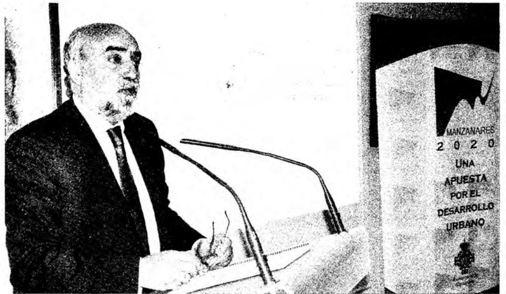
Antonio López de la Manzanara durante la presentación de la estrategia.

El alcalde de la ciudad, Antonio López de la Manzanara, presentó la semana pasada ante más de medio centenar de empresarios y profesionales la estrategia municipal 'Manzanares 2020, una apuesta por el desarrollo urbano'. Se trata de una iniciativa abierta que sienta las bases para acceder en las mejores condiciones a proyectos cofinanciados por la Unión Europea para actuar en materia de promoción económica y empleo, turismo, regeneración urbana, medio ambiente y administración electrónica.