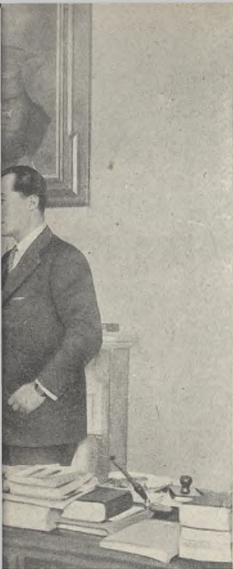
el Primo de Rivera, por Benedito, y la fotografía encontrados, son a los que hace referencia nuestro cola-