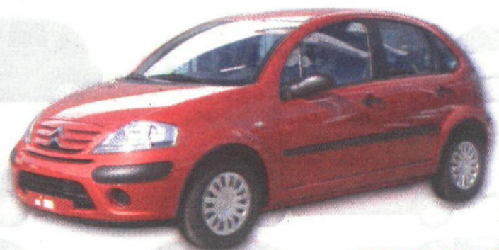
CITROËN C3 1.1i FURIO

EQUIPAMIENTO: ABS CON AYUDA A LA FRENADA DE URGENCIA, APOYACABEZAS TRASEROS ESCAMOTEABLES, AIRBAGS CONDUCTOR Y PASAJERO, RESPALDO TRASERO FRACCIONADO 1/3 2/3, ORDENADOR DE ABORDO, CIERRE CENTRALIZADO CON MANDO ALTA FRECUENCIA, ELEVALUMAS ELÉCTRICOS DELANTEROS, DIRECCIÓN CON ASISTENCIA VARIABLE, VOLANTE REGULABLE EN ALTURA Y PROFUNDIDAD, CIERRE AUTOMÁTICO DE PUERTAS Y MALETERO AL INICIAR MARCHA, APOYA CABEZAS DELANTEROS REGULABLES EN ALTURA, AIRE ACONDICIONADO, MP3 Y PINTURA METALIZADA.