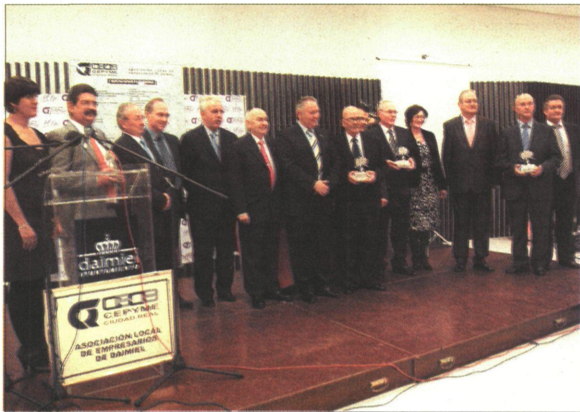
Foto de familia de los premiados en la gala de AEDA, que se celebró el pasado sábado por la noche en Daimiel.

Según los cálculos del máximo mandatario de Cepyme, la Ley de Economía Sostenible estará fun-