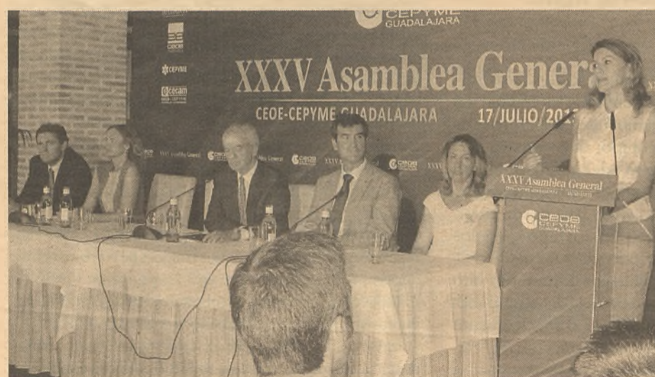
Los empresarios llenaron la sala para escuchar a la presidenta de la Comunidad, así como al resto de intervinientes en la clausura.