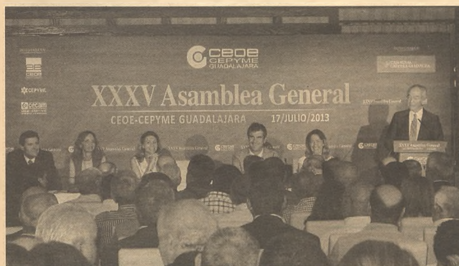
Los empresarios asistentes siguieron con atención todo lo que se decía en la sala, en especial lo referido a las últimas medidas a adoptar para salir de la crisis.