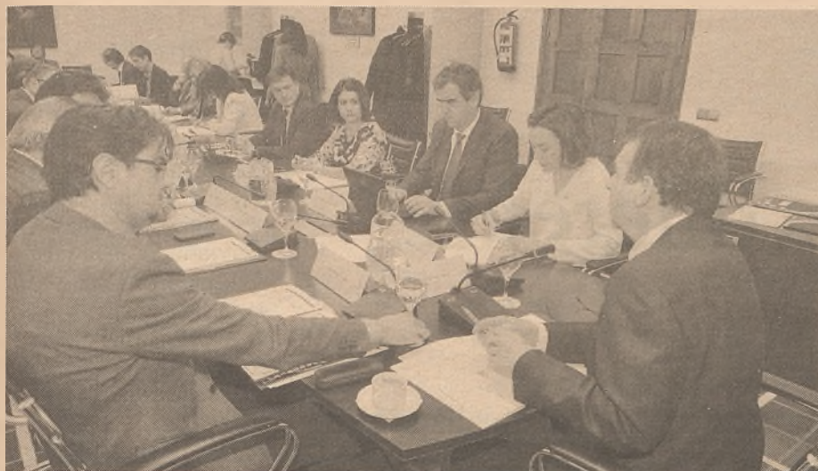
El alcalde en la junta de gobierno de la FEMP.