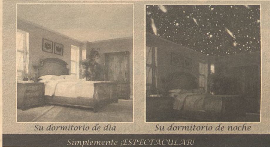
Su dormitorio de día

Donde cada estrella, como explica Villaverde, es un punto, por lo que "hay que ir punto por punto para crear las estrellas y su grosor dependerá de la cantidad de pintura que se le aplique en cada punto". Así, de media, "para unos 9m2 suelo estar dos horas". Un trabajo minucioso donde cada día introduce un elemento nuevo "ahora podemos hacer estrellas fugaces", a lo que sigue diciendo "y ahora estoy mirando para poder hacer constelaciones". Todo, en un ambiente de trabajo "negro", pues se tiene que realizar con la habitación a oscuras "para saber por donde se van poniendo los puntos y que