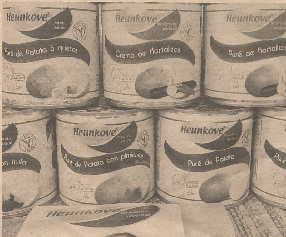
Los nuevos productos siguen la línea de la empresa.

Ese es el motivo por el cual sigue investigando y desarrollando nuevos productos y procedimientos para lograr satisfacer las necesidades de sus clientes, tanto profesionales como particulares.