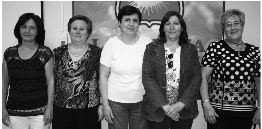
▲ Primera directiva de la nueva asociación.