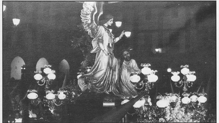
La Oración en el Huerto estrenó carroza el Jueves Santo

Por lo que respecta a las Bandas asistentes, señalar que la de Jesús Rescatado estuvo presente en las de las Palmas, Vera Cruz y Jesús Rescatado, la de San Sebastián acompañó al Santo Entierro, la Municipal solanera participó en la Vera Cruz, Entierro y El Resucitado y la Municipal de Almedina desfiló con Jesús Rescatado.