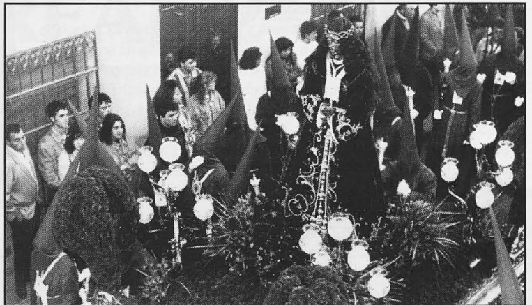
Jesús Rescatado tuvo, como siempre, innumerable acompañamiento de fieles.