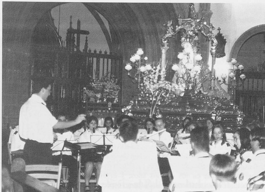
Un momento del concierto de la Banda de Música.

El 24 de septiembre finalizaba el novenario a la Patrona, que como es costumbre se dedicó a los barrios y que predicó el párroco de la Iglesia de Santiago de Ciudad Real, Enrique Galán Rueda. La procesión final recorría las calles solaneras y con la última homilía en la Plaza Mayor concluían los actos en honor a la Virgen, que era subida a su Camarín de Santa Catalina donde permanecerá hasta el mes de enero y donde puede visitarse por los fieles que lo deseen los sábados por la tarde.