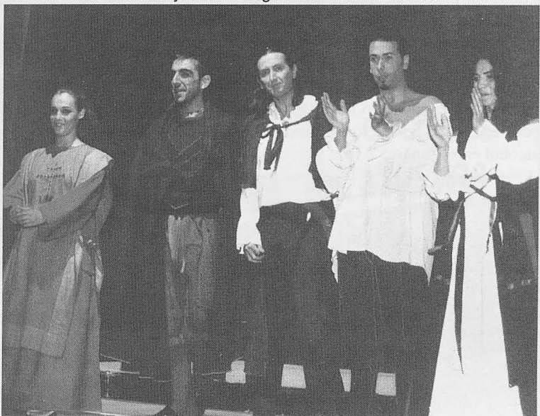
A la derecha, Histrión Teatro representó "Cyrano de Bergerac".