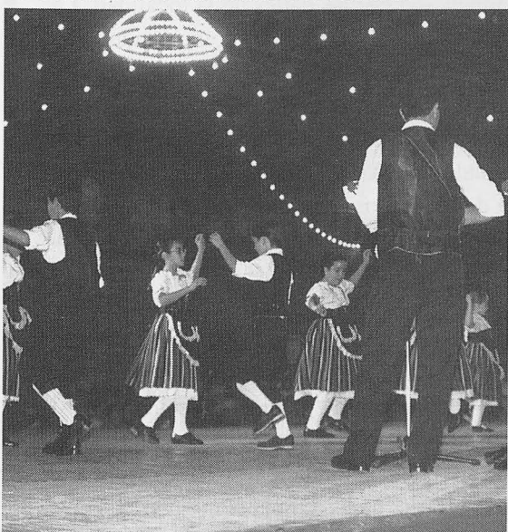
La agrupación "Rosa del Azafrán" en el Festival Folclórico.