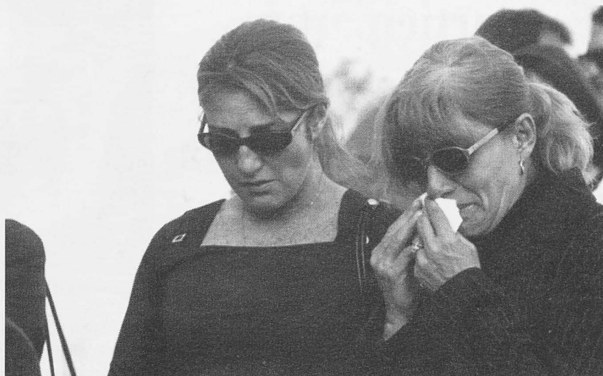
La violencia doméstica provoca situaciones trágicas.

Durante el año 2003, los datos llegan hasta finales de noviembre y nos dicen que se han conocido 30 casos, lo que significa un aumento del 30% respecto al año pasado, y eso sin contar diciembre. De esa treintena de denuncias, 14 de ellas fueron por maltrato físico y psíquico, mientras que del psicológico se han recibido 16, el número de denuncias ha alcanzado las 10, los casos dentro del matrimonio han sido 22 y una vez roto el mismo 6, además se ha producido un