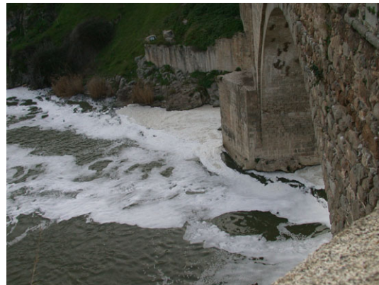
Los episodios de espuma por la contaminación son constantes.

Ponen de manifiesto que este lugar está ubicado en una zona de transición geológica entre la arcillosa y fértil comarca de La Sagra y la silíceo Meseta Cristalina (antesala de los Montes de Toledo), hecho que permite una enorme diversidad de recursos naturales, desde cultivos hortícolas y cereales a zonas de monte mediterráneo que ofrecían leña y madera para las construcciones o piedras de la Meseta Cristalina para la edificación. También conforma un auténtico corredor ecológico, es una zona muy rica en avifauna donde se han llegado a censar hasta 70 especies de aves diferentes, tales como cormoranes, garzas, ánades, gargetas, fochas, etc.