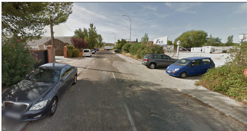
La calle Valdelospozos será otro de los espacios donde se intervendrá.

Nos preguntamos si se contempla algún paso de peatones en estas calles donde se intervendrá, Valdemolinos, Valdelospozos, Valdecavero, Río Estenilla, Río Nogueras y Ventalomar, o sólo se piensa en el automóvil, porque al parecer lo que prima es conseguir más aparcamientos, que hacen falta.